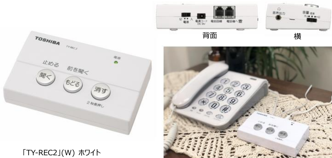
「TY-REC2」(W) ホワイト 防犯用電話自動応答録音アダプター

東芝エルイートレーディング株式会社※は、自宅にある電話に付属の電話線を接続するだけで簡単に取り付けられる、防犯用電話自動応答録音アダプター「TY-REC2」を2019年9月初旬から発売します。着信の際、呼び出し音の前に自動応答メッセージを流すことで不要な電話をブロックし、さらに通話内容を自動録音することで特殊詐欺被害を未然に防止します。